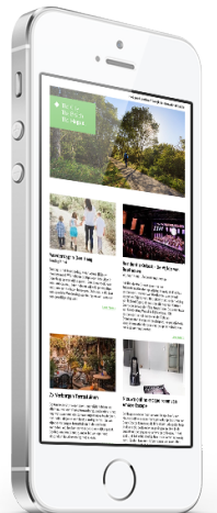
4. Digitale nieuwsbrief

Aanleverspecificaties: één rechtenvrije foto (liggend, JPEG) zonder tekst en logo's in het beeld, tekst (maximaal 100 woorden) en URL van de detailpagina.